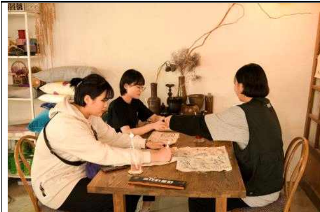
청년문화 대동네지도 청주편 문화충동(충북 청주)

청주 지역 아티스트와 지역 내 공간을 연결하여 지역 주민들과 문화 활동을 통한 문화 생태계 기반 구축