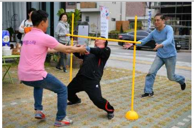
청년 농부 토크콘서트 케이팍스타 초록놀이터(경기 이천)

청주 지역 아티스트와 지역 내 공간을 연결하여 지역 주민들과 문화 활동을 통한 문화 생태계 기반 구축